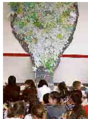
Los escolares, ante la higuera.

:: M.T.B. Los centros educativos ilicitanos se están implicando en la celebración del Centenario del Poeta Miguel Hernández con actividades de diversa índole. Ayer fue el colegio público Candalix el que llevó a cabo una actividad con sus alumnos, aunque el centro ya ha venido desarrollando durante el curso otras iniciativas con este motivo. Así, reunidos en un aula ante un árbol hecho de recortables, que simulaba la higuera que el poeta tenía en su casa natal, los escolares leyeron poemas hernandianos. Inicialmente estaba previsto realizar esta actividad en el exterior, fren-